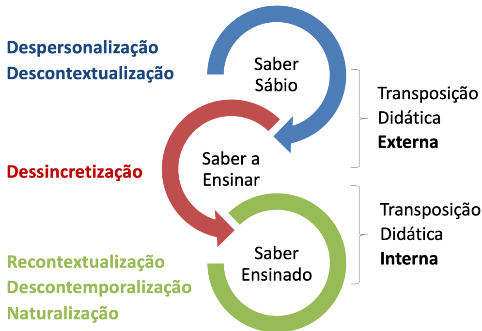
Figura 1. Transformações dos saberes.

6. Naturalização. O saber sábio passa por uma naturalização ao ser ensinado, ou seja, assume sentido sem maiores questionamentos ou discussão sobre o seu significado, origens ou contexto de produção. Sua nova natureza é “sempre foi assim” ( transposição didática interna ).